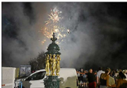
Le feu d'artifice fait partie des arts du spectacle.