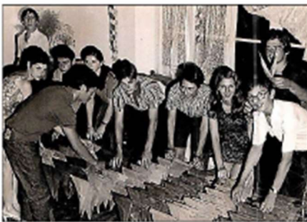
Une joyeuse bande pour la préparation.

Organisée samedi 24 août, la fête de la Barque existe depuis bien longtemps au village.