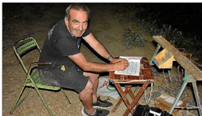
Un artificier doit être intransigeant sur la sécurité.

Il faut respecter la réglementation en vigueur et être strict. C'est essentiel. La sécurité pour soi-même dans son travail car manipuler de tels produits peut être dangereux. La sécurité du public ensuite et surtout. C'est une priorité. Je repère les lieux. Je fais en fonction du temps aussi. Et du